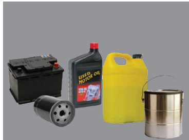
Hazardous Fluid Fluido peligroso