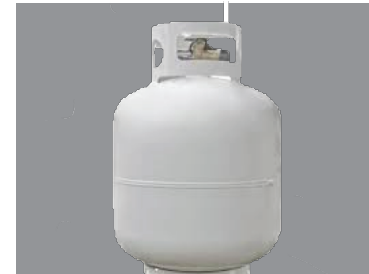
Propane Tanks Tanques de propano