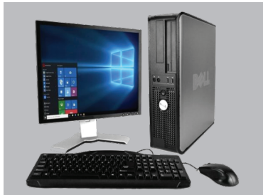
Electronic Waste Desechos electrónicos