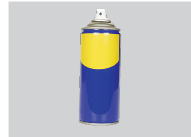
Aerosol Cans Latas de aerosol